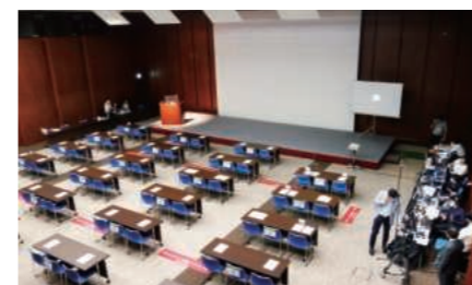
パートナー企業会合では感染予防対策を実施。具体的な内容を中継スタイルで紹介していた