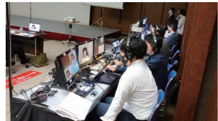
ハイブリッド形式では オンライン配信や 画面切りかえを行う オペレーターと モデレーターとの スムーズな連携が 求められる