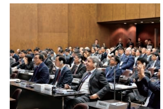
※写真は「神戸国際港湾会議」の様子