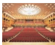
ポートピアホール

神戸空港から約8分のコンベンションエリアの中核に位置するポートピアホテル。 神戸国際会議場、神戸国際展示場などさまざまな施設が隣接。 1702人収容のポートピアホールは、国際会議からコンサートまで幅広く ご利用いただける最新の設備を備えた多目的ホールです。 ホテル内の大小36の宴会場とのコーディネートにより あらゆる研修会・表彰式典・懇親会等にお応えいたします。