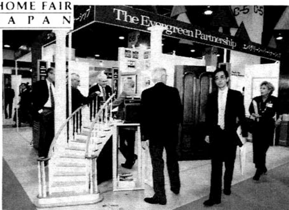
前回の「インターホーム」から

神戸インターホームは、昨年六月、米国をはじめとした海外企業が多数参加する本格的な建材および住宅設備機器の日本初の国際見本市として誕生し、今年はその二回目。 昨年は、入場者数が見込みを大きく上回る八万一千五百八十八人となり、活発な商談が展開され、真に盛況な見本市として大成功を収めた。 今年も、国内、海外を合わせ百三十五社、九団体が三百七十小間の規模で住宅、住宅設備機器、建材、ログハウスなどを出展。会場では、昨年同様、活発な商取引が行われ、さらに、一般消費者と出展企業との情報交換などの盛り上がりも期待されている。 日本の住宅建設は質の時代に入っており、消費者のニーズはますます高級化、多様化して欧米の様式や設備、資材がどんどん採り入れられている。主催者は、このような住宅市場の変化にあわせ、国際的な様々な新しい情報を、輸入